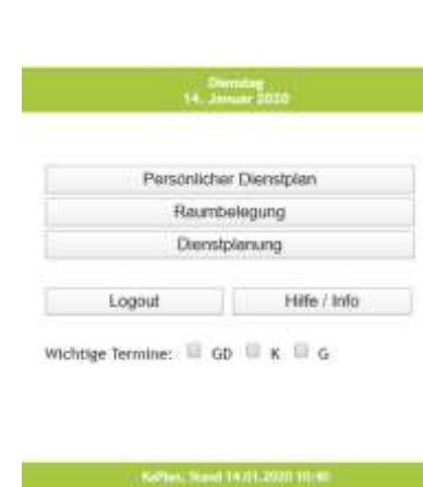
Abbildung 1 Menü

Loggen Sie sich nun den Vorgaben entsprechend im Programm ein und legen Sie ein persönliches Passwort fest.