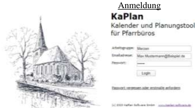
Abbildung 2 Login

Loggen Sie sich nun den Vorgaben entsprechend im Programm ein und legen Sie ein persönliches Passwort fest.