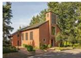
St. Marien Rotherthausen