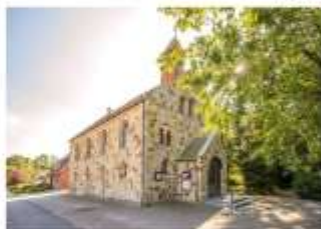
St. Clemens Schlichthorst

Wir laden in den Sommerferien dazu ein, unsere Kapellengemeinden Schlichthorst und Rotherthausen zur „kleinen Sommerkirche“ zu besuchen – Hl. Messen mit Raum zum Durchatmen und kleinen Impulsen. Im 14tägigen Wechsel. Herzlich willkommen!