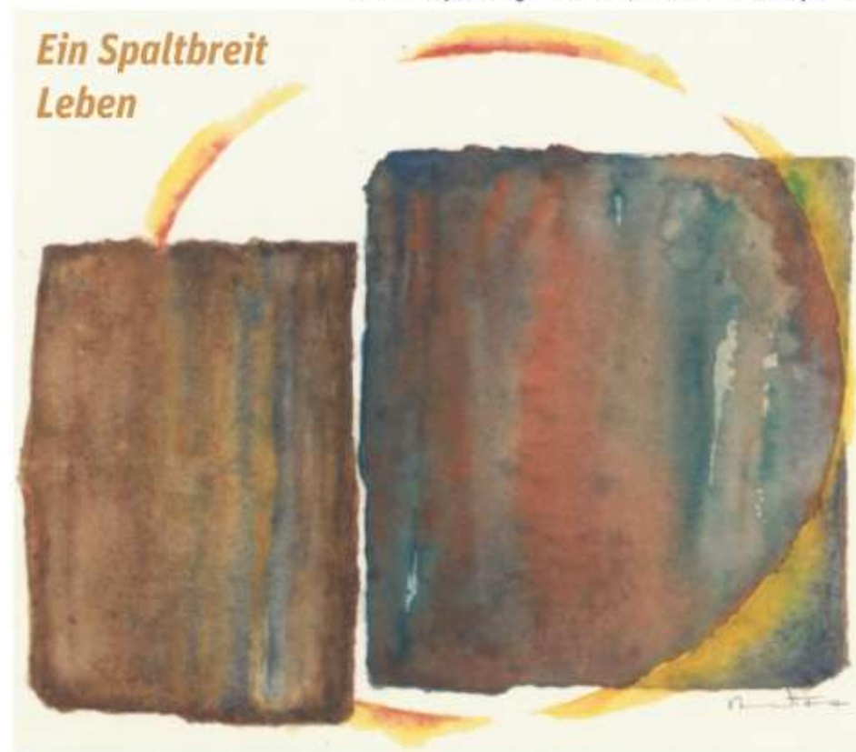
Benedikt Werner Traut, Hintergrund 1991, Aquarell, 20 x 20cm, aus: Deine Auferstehung - mein Leben, © Christusbruderschaft Selbitz

Christus verteilt sich und gibt sein Leben hin, uns zum Licht und zum Leben zu erheben.