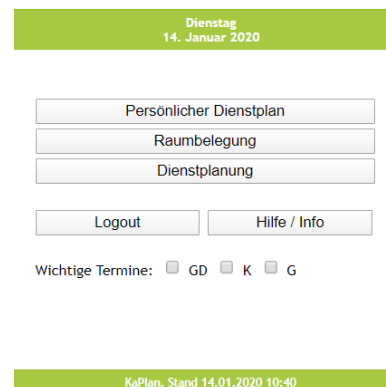
Abbildung 2 Menü

Nachdem Sie sich eingeloggt und das Passwort festgelegt haben, kommen Sie zum Menü der Software. Hier stehen Ihnen je nach Aufgabe unterschiedliche Möglichkeiten zur Verfügung.