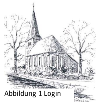
Abbildung 1 Login