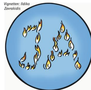
Vignetten: Ildiko Zavrakidis

Voltlage, Voltlager Hof 13.00 Uhr, Neuenkirchen, Kirche 13.10 Uhr Merzen, Kirche 13.30 Uhr, abschließend in Plaggenschale bei Heile