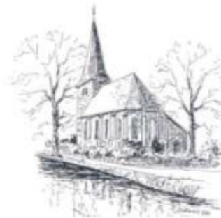
Abbildung 1 Login