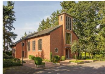
St. Marien Rothertshausen