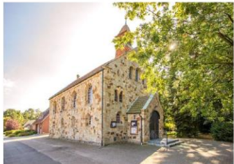
St. Clemens Schlichthorst

Wir laden in den Sommerferien dazu ein, unsere Kapellengemeinden Schlichthorst und Rothertshausen zur „kleinen Sommerkirche“ zu besuchen – Hl. Messen mit Raum zum Durchatmen und kleinen Impulsen. Im 14tägigen Wechsel. Herzlich willkommen!