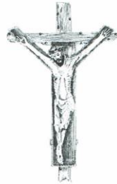
Kreuz zu Lage

in der Wallfahrtskirche St. Johannes der Täufer, Lage 7, 49597 Rieste