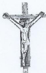
Kreuz zu Lage

in der Wallfahrtskirche St. Johannes der Täufer, Lage 7, 49597 Rieste