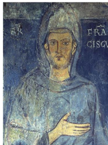
Am 4. Oktober feiert die Kirche den heiligen Franz von Assisi. Das älteste, noch zu Lebzeiten entstandene Bild des Heiligen ist ein Fresko im Kloster San Benedetto in Subiaco.

Herr, mach mich zum Werkzeug deines Friedens, dass ich Liebe übe, wo man sich hasst, dass ich verzeihe, wo man beleidigt, dass ich versöhne, wo Streit ist, dass ich Wahrheit bringe, wo Irrtum herrscht, dass ich Hoffnung bringe, wo Verzweiflung quält, dass ich dein Licht bringe, wo es finster ist, dass ich Freude bringe, wo Kummer wohnt. Herr, lass mich lieber trösten, als getröstet werden, lass mich lieber verstehen, als verstanden werden, lass mich eher lieben, als geliebt werden, den wer gibt, der empfängt, wer sich selbst vergisst, dem strömt es zu, wer verzeiht, dem wird verziehen, wer in dir stirbt, Herr, erwacht zum ewigen Leben.